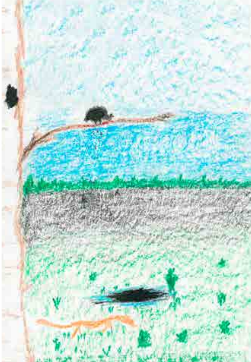
репродукция рисунка Даниила Доброва